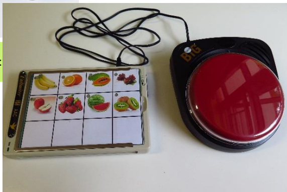
拍擊連於另一個有掃視功能的VOCA