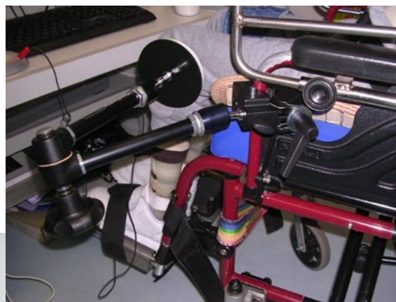
拍擊連於有掃視功能的電腦軟件